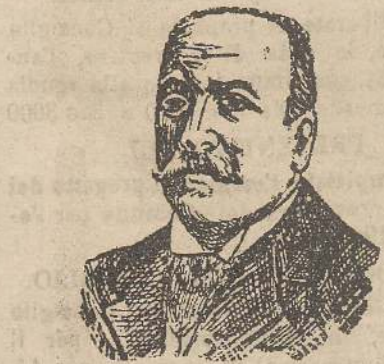
On. Signor Sindaco

Coloro che la fabbricano dicono, naturalmente, che durerà in eterno: invece molti che vedono con inquietudine come vada diminuendo sempre più l'uso degli stracci nella preparazione della pasta per la carta, fanno le più tristi previsioni, e dicono che dei libri che ora si stampano sarà spariti, in tempo relativamente breve, ogni traccia, mentre invece i li-