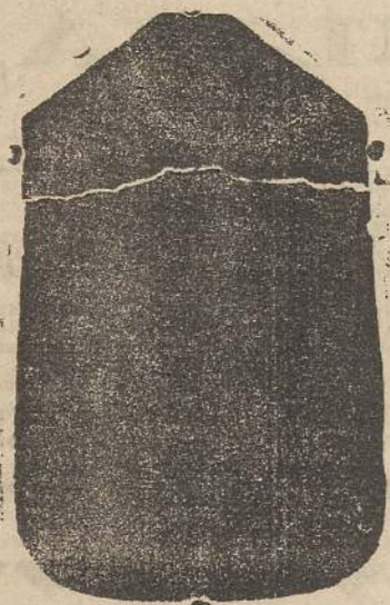
Pianeta seta L. 24