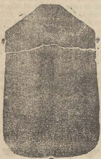
Pianeta seta L. 24