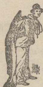
Uso sempre Emulsione con la marca "pescatore" che distingue dalla falsificazione.

nella intonazione e ricostituzione degli organismi impoveriti sono dovuti alla purezza assoluta dei componenti (olio di fegato di merluzzo e ipofosfiti di calce e soda) ed alla forma chimica di composizione esclusiva di Scott, che ne sviluppa il potere. Questi vantaggi non si possono ottenere con nessuna delle altre emulsioni imitanti la Scott. La marca di fabbrica ("pescatore norvegese con un grosso merluzzo sul dorso") posta sulla fasciatura delle bottiglie è quella della emulsione autentica, che risponde alle indicazioni mediche e non lascia deluso chi la prende.