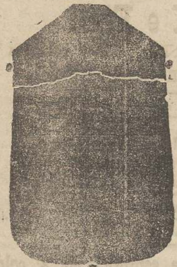
Pianeta seta L. 24