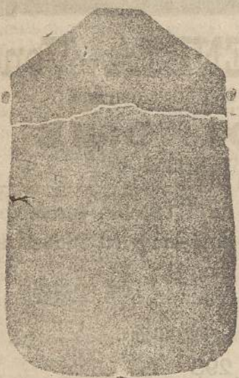
Pianeta seta L. 24

Confezione di qualsiasi abito Sacerdotale