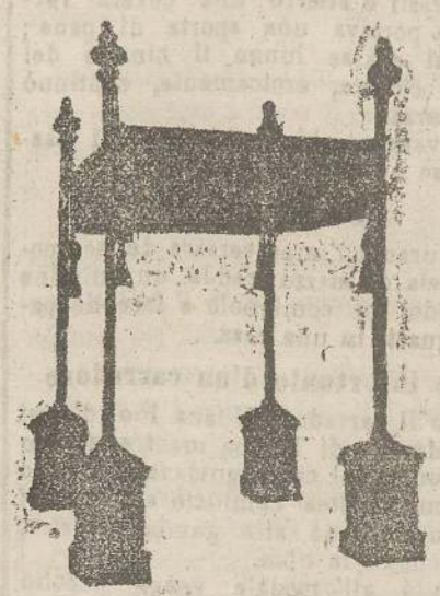
Baldacchini L. 150