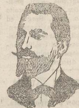
L'on. Odorico impresario dei lavori.

S. Giacomo, Ragogna. Anche qui dalle finestre pende il tricolore. Archi di paloncini alla veneziana sono tesi attraverso