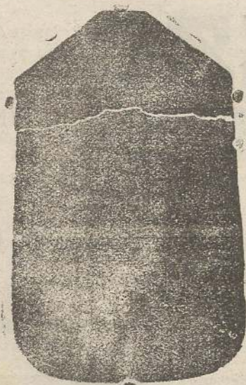
Pianeta seta L. 24