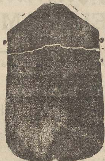
Pianeta seta L. 24