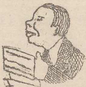
Ride, leggendo che i cattolici non voteranno coi moderati.