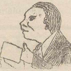
È semiserio leggendo che forse i cattolici si uniranno ai moderati.