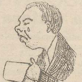
È serio leggendo che i cattolici si sono uniti ai moderati.

E che serio resti anche domani a sera è l'augurio che facciamo.