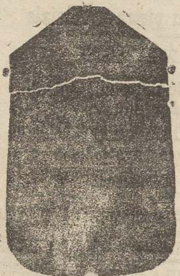
Pianeta seta L. 24