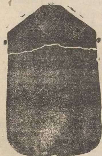
Pianeta seta L. 24