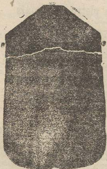
Pianeta seta L. 24

Confezione di qualsiasi abito Sacerdotale