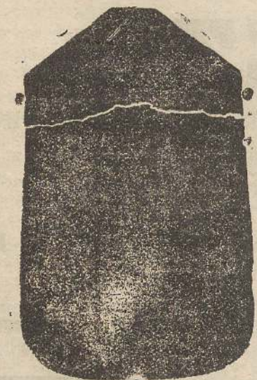
Pianeta seta L. 24

Pettinati, Panni, Renforcè, Scotti, Thubet per mantelli alla Romana Neri, Impermeabili confezionati, Tele di puro lino candide e nostrane, Lana da letto, Coperte lana e cotone, Copertori bianchi e colorati, Stoffe per mobili, Flanelle bianche e colorate, Maglie lana e cotone, Fazzoletti filo e cotone, Stoffe lana e cotone, uomo e donna, Cottonine candide, e colorate ad olio per tendoni in tutti i colori e qualunque articolo in manifatture.