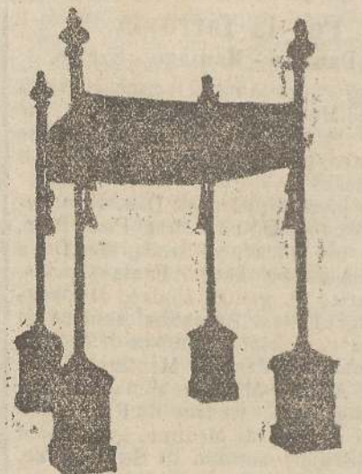
Baldacchini L. 150