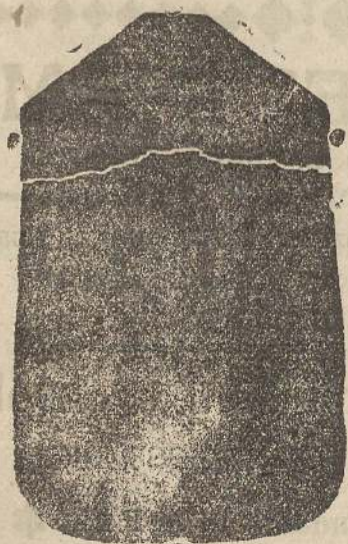
Pianeta seta L. 24