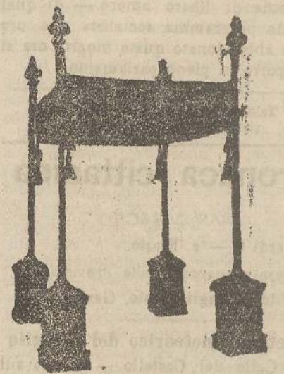
Baldacchini L. 150