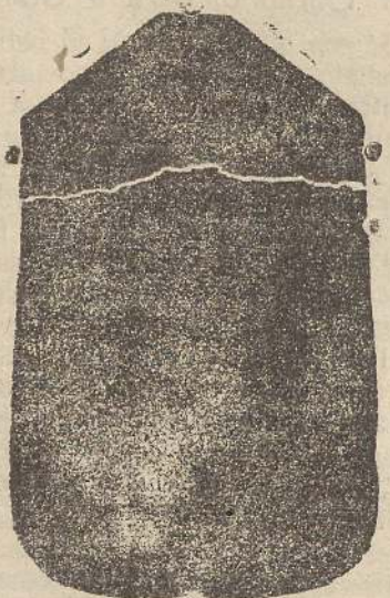
Pianeta seta L. 24