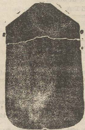
Pianeta seta L. 24