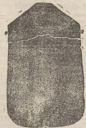
Pianeta seta L. 24

Pettinati, Panni, Renforcè, Scotti, Thubet per mantelli alla Romana Neri, Impermeabili confezionati, Tele di puro lino candide e nostrane, Lana da letto, Coperte lana e cotone, Copertori bianchi e colorati, Stoffe per mobili, Flanelle bianche e colorate, Maglie lana e cotone, Fazzoletti filo e cotone, Stoffe lana e cotone, uomo e donna, Cotinine candide, e colorate ad olio per tendoni in tutti i colori e qualunque articolo in manifatture.