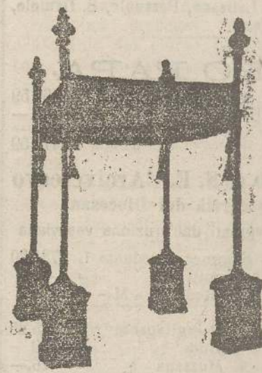
Baldacchini L. 150