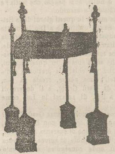
Baldacchini L. 150