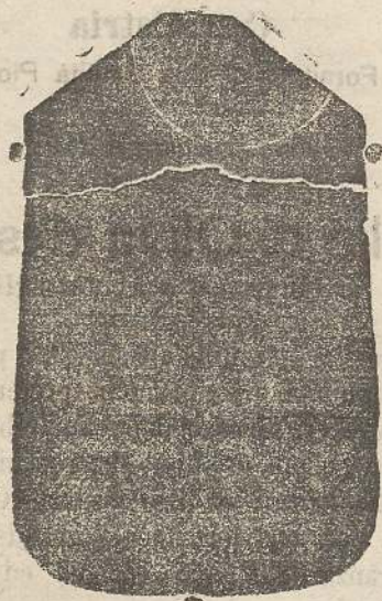
Pianeta seta L. 24