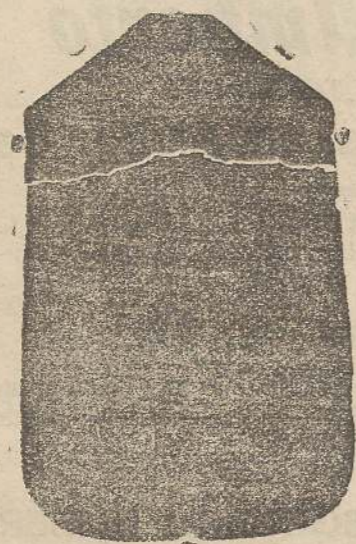
Pianeta seta L. 24