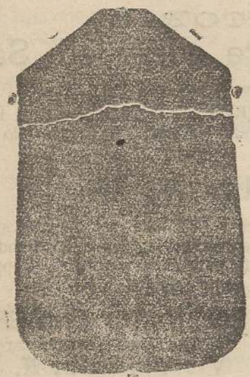
Pianeta seta L. 24