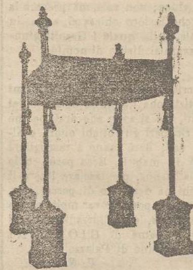
Baldacchini L. 150