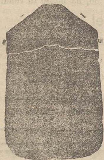
Pianeta seta L. 24