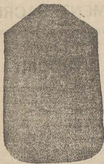
Pianeta Dam. seta L. 24 Tomceile > 48 Privato > 50

Deposito e confezione Arredi sacri — Fondata nel 1882 — Filati oro e argento fino per ricamo 900/000