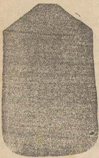
Pianeta Dam. seta L. 24 Toniceile > 48 Piviale > 50

Premiato con medaglia d'oro all'Esposizione Regionale di Udine 1903 Deposito e confezione Arredi sacri — Fondata nel 1882 — Filati oro e argento fino per ricamo 900/000