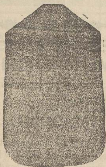
Pianeta Dam. seta L. 24 Touccelle > 48 Piviale > 50

Deposito e confezione Arredi sacri - Fondata nel 1882 - Filati oro e argento fino per ricamo 900/1000