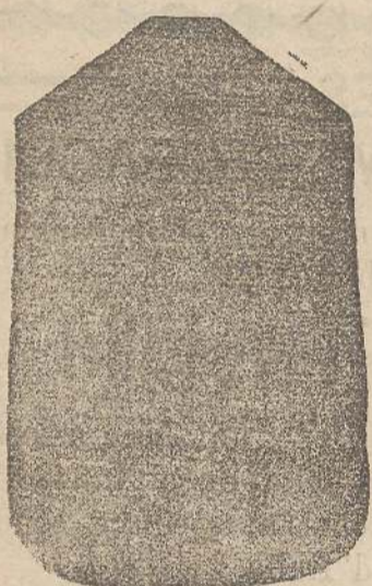
Pianeta Dam. seta L. 24 Tonaceile > 48 Piviale > 50

Premiato con medaglia d'oro all'Esposizione Regionale di Udine 1903 Deposito e confezione Arredi sacri -- Fondata nel 1882 -- Filati oro e argento fino per ricamo 900/000