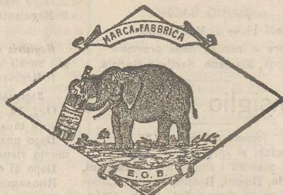
Marca speciale depositata.

Valenti autorità mediche lo dichiarano il più efficace ed il migliore ricostituente tonico digestivo dei preparati consimili, perchè la presenza del RABARBARO, oltre d'attivare una buona digestione, impedisce anche la stitichezza originata dal solo FERRO-CHINA.