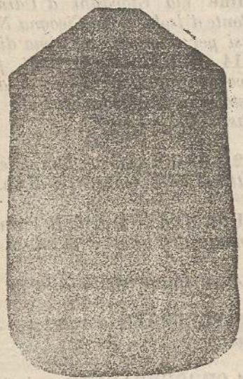
Pianeta Dam. seta L. 24 Toncille > 48 Piviale > 50

Deposito e confezione Arredi sacri — Fondata nel 1882 — Filati oro e argento fino per ricamo 900/1000