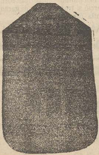
Pianeta Dam. seta L. 24 Toncille > 48 Piviale > 50

Premiato con medaglia d'oro all'Esposizione Regionale di Udine 1903 Deposito e confezione Arredi sacri - Fondata nel 1882 - Filati oro e argento fino per ricamo 900/1000