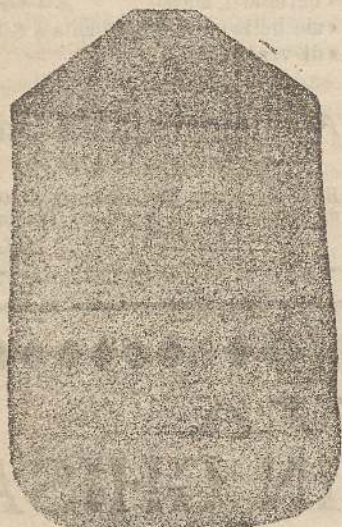
Pianeta Dam. seta L. 24 Tonocella > 48 Piviale > 50

Deposito e confezione Arredi sacri — Fondata nel 1882 — Filati oro e argento fino per ricamo 900/000