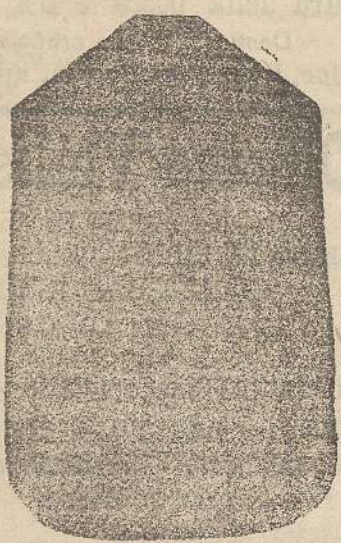
Planeta Dam. seta L. 24 Toniceile > 48 Piviale > 50

Deposito e confezione Arredi sacri - Fondata nel 1882 - Filati oro e argento fino per ricamo 900/000