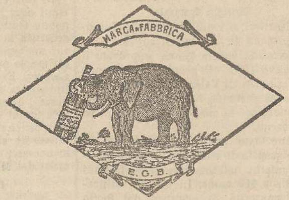
Marca speciale depositata.

Valenti autorità mediche lo dichiarano il più efficace ed il migliore ricostituente tonico digestivo dei preparati consimili, perchè la presenza del RABARBARO, oltre d'attivare una buona digestione, impedisce anche la stitichezza originata dal solo FERRO-CHINA.