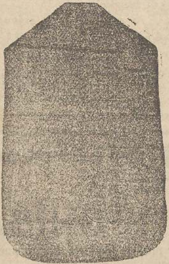
Pianeta Dam. seta L. 24 Tonnicelle > 48 Piviale > 50

Deposito e confezione Arredi sacri -- Fondata nel 1882 -- Filati oro e argento fino per ricamo 900/1000