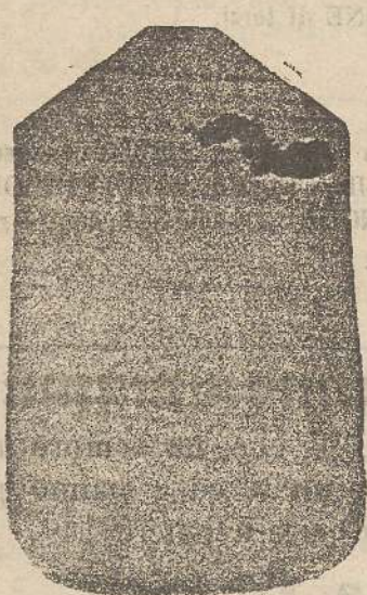
Pianeta Dam. seta L. 24 Toncille > 48 Piviale > 50

Deposito e confezione Arredi sacri -- Fondata nel 1882 -- Filati oro e argento fino per ricamo 900/1000