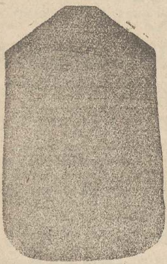
Pianeta Dam. seta L. 24 Touccelle > 48 Piviale > 50

Deposito e confezione Arredi sacri — Fondata nel 1882 — Filati oro e argento fino per ricamo 900/1000