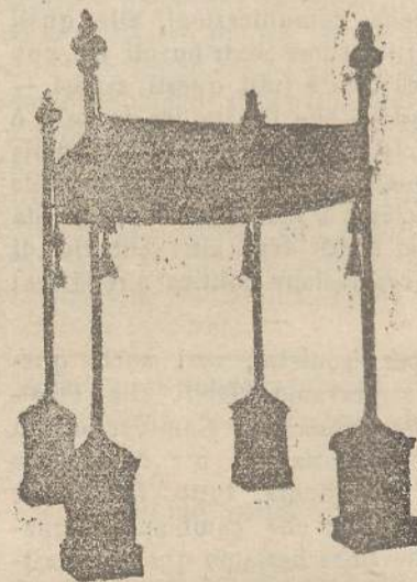
Baldacchini in Damasco seta con aste da L. 155, 200, 300, 350, 400 in più.

Apparamenti completi, Pianete, Stole, Veli Omerali, Abiti da Vergine, Veli ricamati, sul Thùl in seta e oro, Copri pisside, Ombrelle per Viatico, Stratti mortuari, Parapetti altare, Tappeti per coro, Padiglioni per altare in seta, bourette e cotone, Cingoli, Merli candidi per camici e cotte, Colonnami seta in tutte le altezze, Broccati, Damaschi, Grisette, Frangie, Galloni, Tocche, Stelle, fiocchi oro, seta e argento, Cordoni, Tele filo Rosa per confraternite.