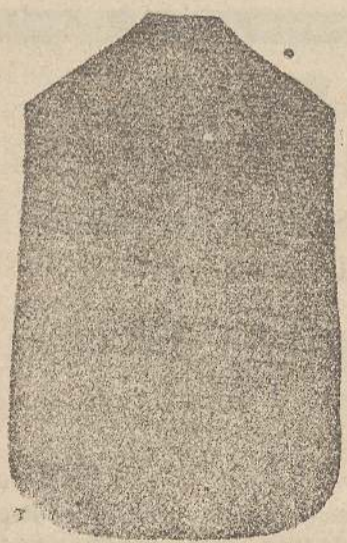
Pianeta Dam. seta L. 24 > 48 Toucello > 50 Piviale > 50

Deposito e confezione Arredi sacri - Fondata nel 1882 - Filati oro e argento fino per ricamo 900/1000