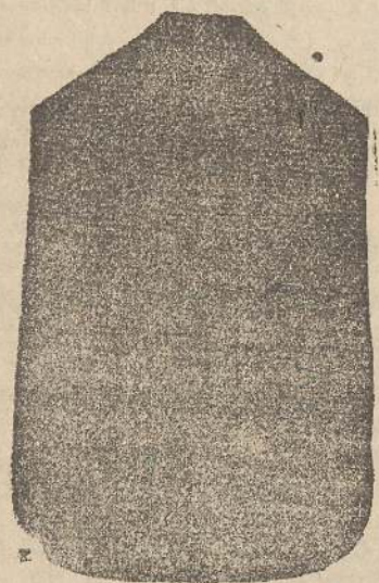
Pianeta Dam. seta L. 24 Touceile > 48 Piviale > 50

Deposito e confezione Arredi sacri - Fondata nel 1882 - Filati oro e argento fino per ricamo 900/000