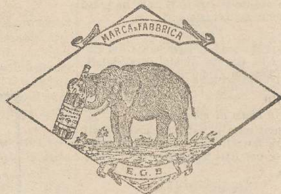
Marca speciale depositata.

Valenti autorità mediche lo dichiarano il più efficace ed il migliore ricostituente tonico digestivo dei preparati consimili, perchè la presenza del RABARBARO, oltre d'attivare una buona digestione, impedisce anche la stitichezza originata dal solo FERRO-CHINA.