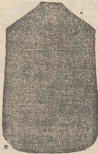
Pianeta Dam. seta L. 24 Tonceile > 48 Piviale > 50

Deposito e confezione Arredi sacri — Fondata nel 1882 — Filati oro e argento fino per ricamo 900/1000