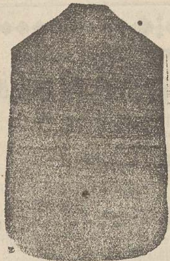
Pianeta Dam. seta L. 24 Touccelle > 48 Piviale > 50

Premiato con medaglia d'oro all'Esposizione Regionale di Udine 1903 Deposito e confezione Arredi sacri -- Fondata nel 1882 -- Filati oro e argento fino per ricamo 900/1000