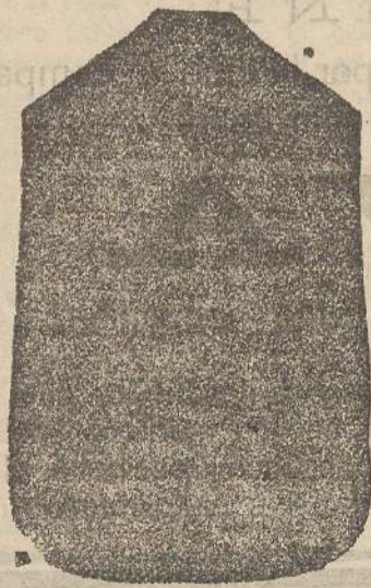
Pianeta Dam. seta L. 24 Tonaceile > 45 Piviale > 50

Premiato con medaglia d'oro all'Esposizione Regionale di Udine 1903 Deposito e confezione Arredi sacri -- Fondata nel 1882 -- Filati oro e argento fino per ricamo 900/000