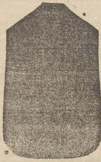
Pianeta Dam. seta L. 24 Tonacelle > 48 Piviale > 50

Premiato con medaglia d'oro all'Esposizione Regionale di Udine 1903 Deposito e confezione Arredi sacri — Fondata nel 1882 — Filati oro e argento fino per ricamo 900/000