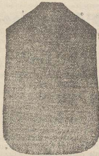
Pianeta Dam. seta L. 24 Tonicele > 48 Piviale > 50

Deposito e confezione Arredi sacri — Fondata nel 1882 — Filati oro e argento fino per ricamo 900/000