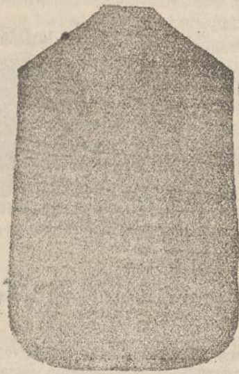
Pianeta Dam. seta L. 24 Tonicelle > 48 Piviale > 50

Deposito e confezione Arredi sacri - Fondata nel 1882 - Filati oro e argento fino per ricamo 900/000