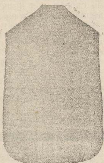
Pianeta Dam. seta L. 24 Tonicelle > 48 Piviale > 50

Premiato con medaglia d'oro all'Esposizione Regionale di Udine 1903 Deposito e confezione Arredi sacri -- Fondata nel 1882 -- Filati oro e argento fino per ricamo 900/1000