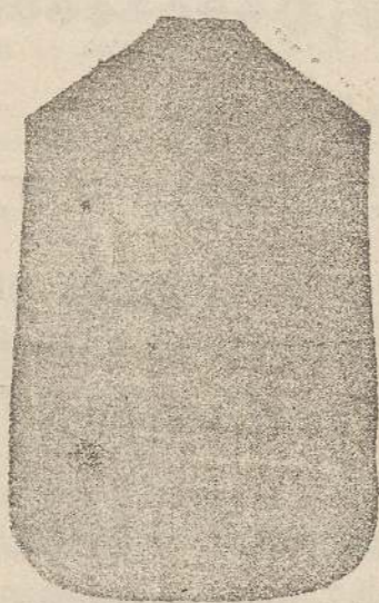
Pianeta Dam. seta L. 24 Tonicelle > 48 Piviale > 50

Premiato con medaglia d'oro all'Esposizione Regionale di Udine 1903 Deposito e confezione Arredi sacri - Fondata nel 1882 - Filati oro e argento fino per ricamo 900/1000