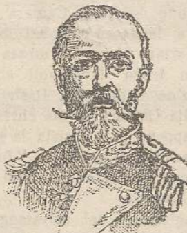
Il Re di Svezia

In base alla sua costituzione la Norvegia avrebbe avuto diritto a una diplomazia e a uno stato consolare proprio.