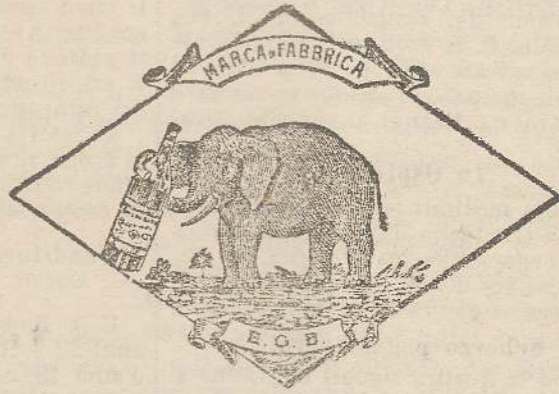
Marca speciale depositata.

Valenti autorità mediche lo dichiarano il più efficace ed il migliore ricostituente tonico digestivo dei preparati consimili, perchè la presenza del RABARBARO, oltre d'attivare una buona digestione, impedisce anche la stitichezza originata dal solo FERRO-CHINA.